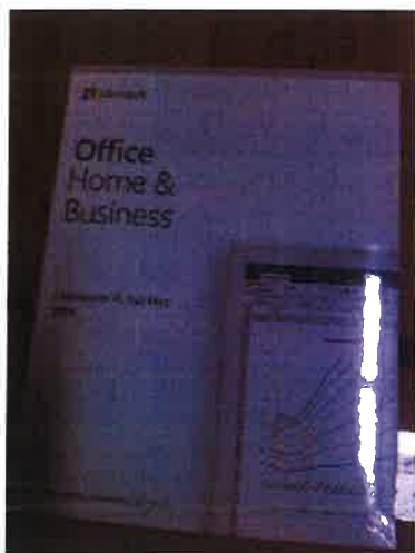
Rys. 3 Przykładowe zdjęcie pudełka dla produktu Microsoft Home&Business.

Jesteśmy przekonani, że dzięki takiemu zapisowi do wzoru umowy Zamawiający otrzyma od potencjalnego Wykonawcy w pełni oryginalne oprogramowanie zgodne z warunkami licencjonowania producenta oprogramowania. W przeciwnym razie Zamawiający - jako odbiorca końcowy, ponoszący odpowiedzialność za oprogramowanie które zakupił – narazi się na konsekwencje finansowe i prawne, związane z użytkowaniem nielegalnego lub zabronionego, używanego wcześniej oprogramowania.